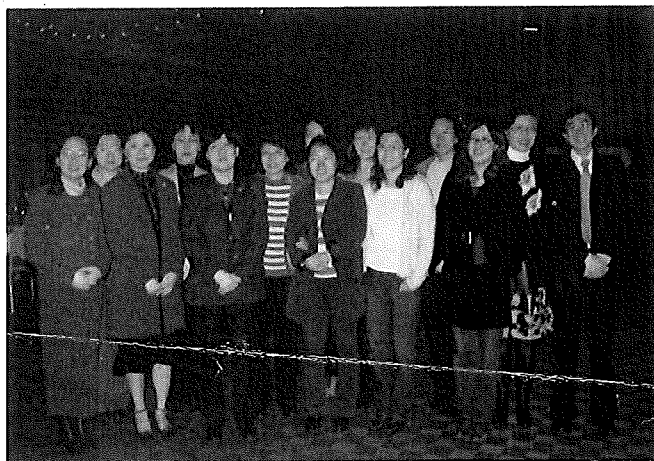
学校老师,工作人员与大使馆官员合影